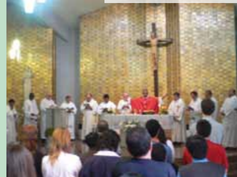
La cappella dove i capitolari celebreranno la S. Messa.

Sarà la seconda volta nella storia della Congregazione di San Giuseppe che il Capitolo Generale (CG) avrà luogo fuori dai confini italiani. Dopo il XXI CG, tenutosi in Brasile nel 2006, la prossima sede del XXII CG, nel giugno 2012, sarà in Argentina, presso la "Casa de Ejercicios Espirituales María Auxiliadora", nella città di San Miguel (provincia di Buenos Aires). La sede è già conosciuta dai Giuseppini e dalla Famiglia del Murialdo. Infatti nel 2008 vi si tenne il "Seminario Pedagogico Internazionale". L'accoglienza ospitale e fraterna delle Opere e delle Comunità della Provincia Argentino-Cilena sicuramente accompagnerà e sosterrà i Capitolari provenienti da ogni parte del mondo "giuseppino"! ■