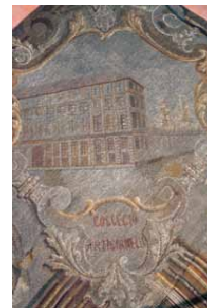
In uno degli angoli dell'arazzo-tappeto è disegnato il Collegio Artigianelli.