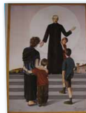
Affresco della Cappella dell'Opera di Valbrembo (BG).