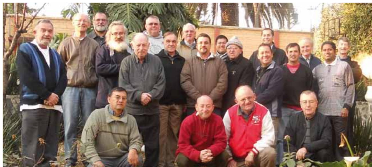
21 confratelli hanno preso parte al capitolo della Vice-Provincia Usa-México riuniti in Tlalpan, DF, dal 3 al 5 gennaio 2012.

dandosi durante il corso degli anni in San Pedro (California), in Avon (Ohio), e in Lancaster (California). Negli anni novanta si procedette alle fondazioni di comunità nel Messico: prima Hermosillo, SO (1991), poi San Jorge, DF (1992), quindi Aguascalientes, AGS (1993), infine Tlalpan, DF (1997). I campi di apostolato fanno riferimento alle parrocchie (5), alla pastorale specifica con i gruppi giovanili (7), a scuole (2), a centri sociali con corsi di formazione professionale (2), all'educa-