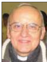
di P. GIUSEPPE FOSSATI

Nei primi giorni di ottobre del 1866, il Murialdo, dopo un anno scolastico trascorso nel Seminario di San Sulpizio a Parigi, dove si era recato per approfondire gli studi teologici e per conoscere alcune istituzioni in favore della gioventù, ritorna a Torino e gli viene proposto di assumere la direzione del Collegio Artigianelli che si trovava in una situazione difficile sotto molteplici punti di vista, da quello formativo a quello economico. Questa istituzione che, dopo varie sedi fu trasferita, nel