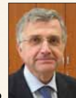
di GIUSEPPE NOVERO