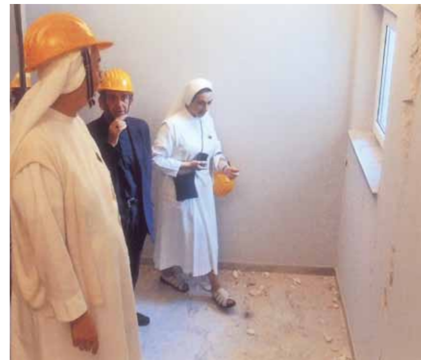
P. Mario visita la casa generalizia delle Missionarie della Dottrina Cristiana colpita dal terremoto del 06.04.09. La madre generale ringrazia i lettori di Vita Giuseppina che, dopo l'articolo apparso sul n.7 sett.-ott. 2009, hanno mandato offerte per la ricostruzione della loro scuola elementare.